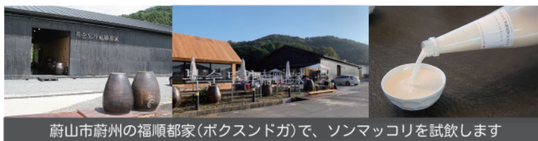
蔚山市蔚山の福順都家(ボクスンドガ)で、ソナムッコリを試飲します

チャガルチ市場 釜山タワーや国際市場からもすぐの所にあります。毎日夜明け前から遠近海の300種を越える魚介類が次々と運び込まれ活気に包まれています。